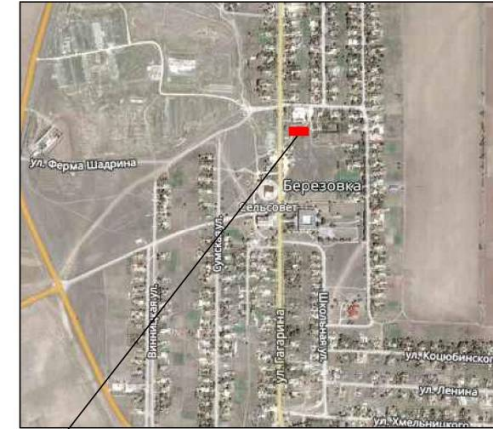
Месторасположение земельного участка