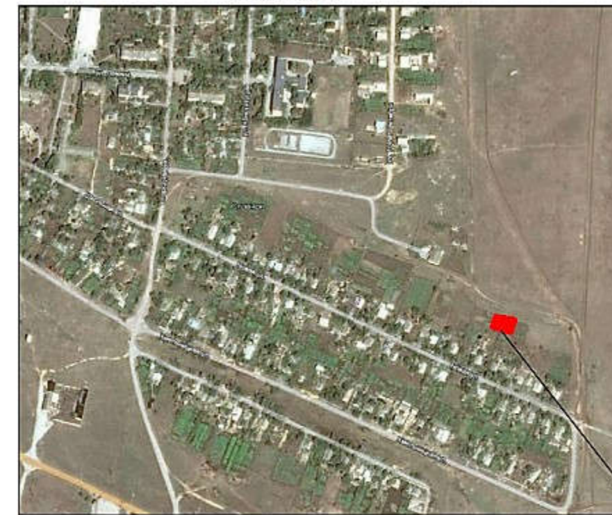
Месторасположение земельного участка