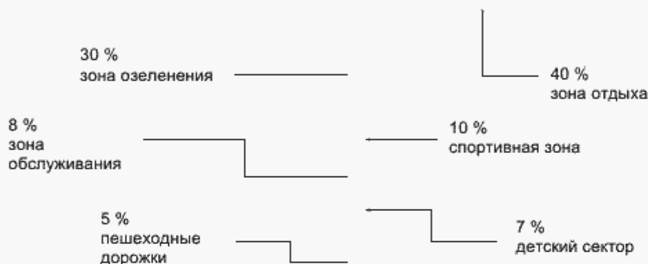
Рисунок 1 - Схема функционального зонирования территории пляжа

Примерная схема функционального зонирования территории пляжа приведена на рисунке 1.