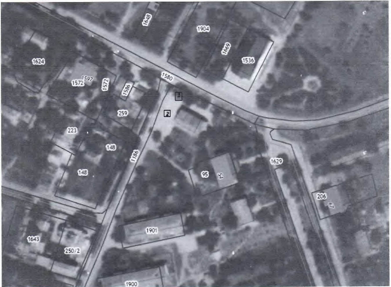
Схема размещения мест нестационарных торговых объектов на территории муниципального образования Ковыльновское сельское поселение Раздольненского района Республики Крым (графическая часть с.Ковыльное)

1 - с.Ковыльное ул.Восточная (торговая площадь), площадь земельного участка под НТО- 20 кв.м.