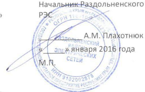
ГРАФИК ВРЕМЕННОГО ОГРАНИЧЕНИЯ

электроэнергии по Раздольненскому району на 2016 год при лимите 6,0 МВт