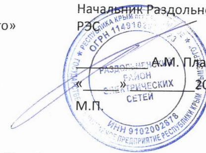
ГРАФИК ВРЕМЕННОГО ОГРАНИЧЕНИЯ электроэнергии по Раздольненскому району на 2016 год при лимите 6,0 МВт