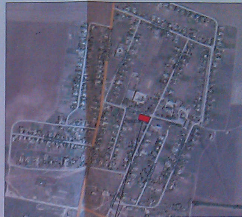
Месторасположение земельного участка