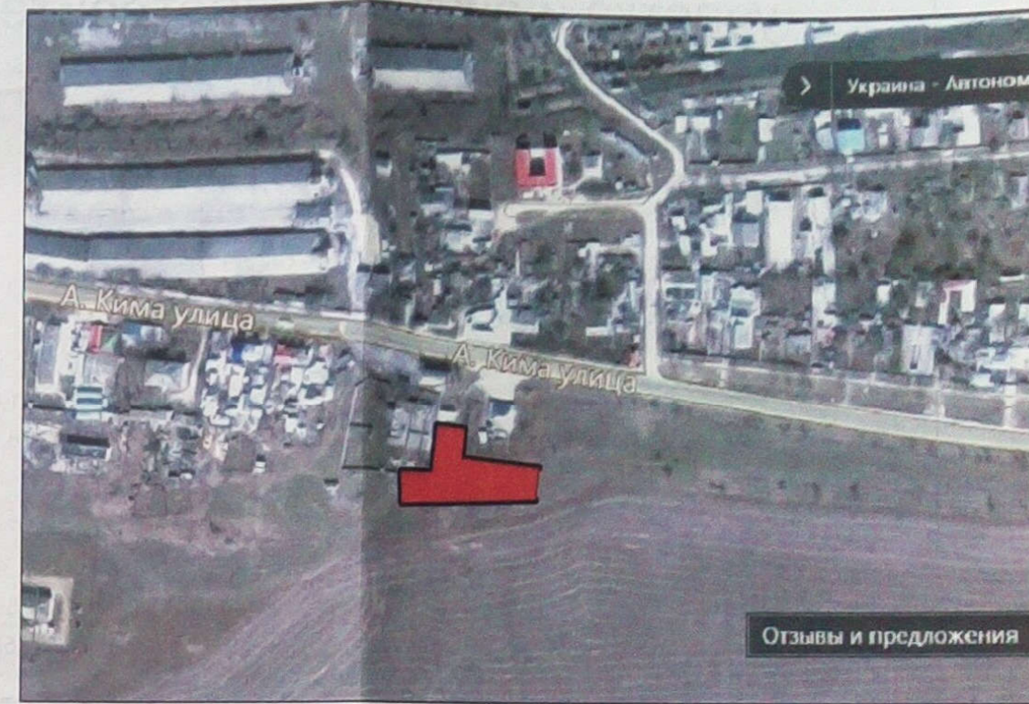
Месторасположение земельного участка